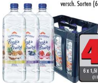
Lichtenauer Fresh & Fruity versch. Sorten (6 x 1,5l)