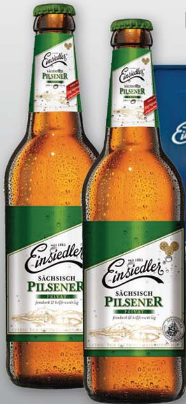
Einsiedler Sächsisch Pilsener (20 x 0,5l)