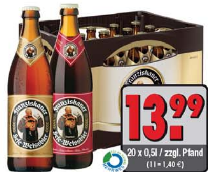
Franziskaner Hefe Hell/Dunkel (20 x 0,5l)