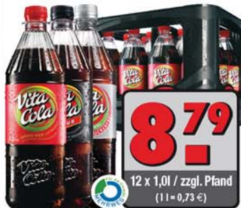
Vita Cola Original/Pur/Zuckerfrei (12 x 1,0l)