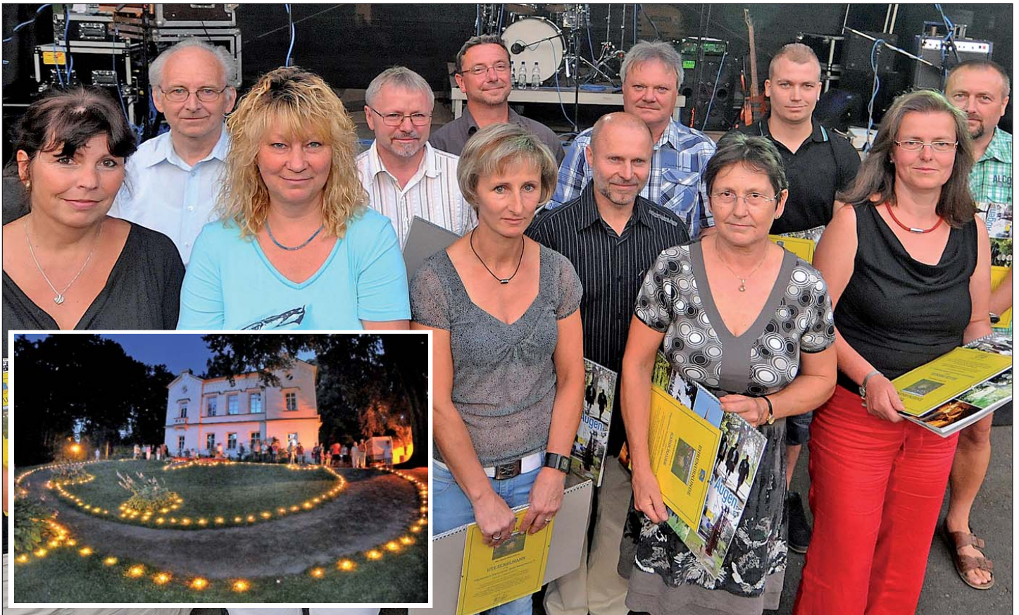
mehr dazu auf Seite 20; Bilder: Falk Bernhardt