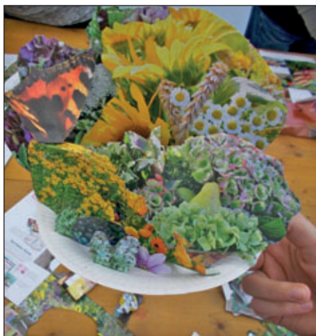
Erwachsene und Kinder haben kunstvoll »angereichert«, Arbeitszustände vom Kreativtag am 27.12.17, wo auch Taschen und Recycling-Schmuckstücke entstanden sind.

Kreativangebot am Sonntag, 28. Januar 2018, 13.00 bis 14.30 Uhr, am Mittwoch, 14. Februar 2018, 10.00 bis 12.30 Uhr