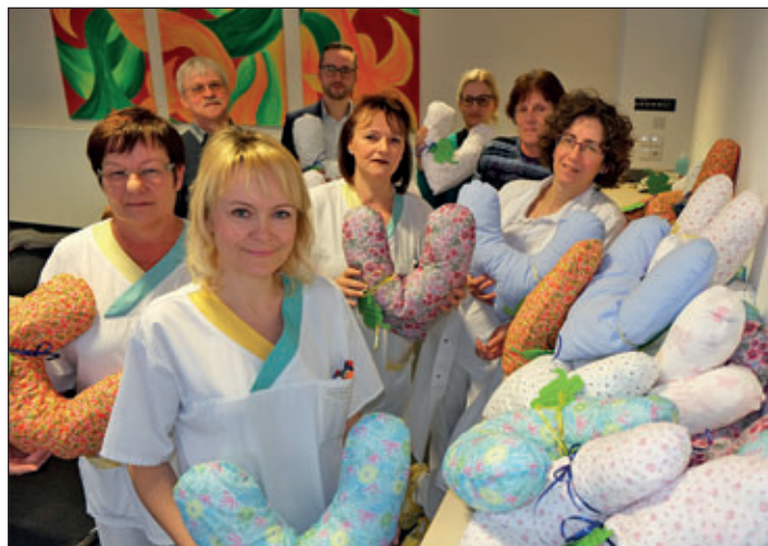
Das Team des Mittweidaer Brustzentrums konnte Mitte Dezember wieder 35 liebevoll gestaltete Herzkissen für die Patientinnen im Empfang nehmen.

auf Grundsicherung angewiesen sind, für eine Rückkehr ins Erwerbsleben zu BIC: GENODEF1MIW aktivieren. Eine bessere und intensivere Betreuung ist die Voraussetzung für eine nachhaltige Vermittlung von Langzeitarbeitslosen in Arbeit. Daher setzt das Jobcenter Mittelsachsen mit Hilfe seines Netzwerkes ABC auf eine enge Zusammenarbeit mit allen wichtigen Arbeitsmarktakteuren um gemeinsam eine passgenaue Beratung anzubieten.