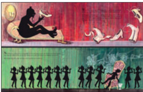
Screenshot/Auszug: Die zertanzten Schuhe (Gebrüder Grimm), Malerei und Papierschnitt, erschienen bei Yeowon Media, Seoul

»Vom Welt Lauf« - Bei Kaffee und Kuchen erfahren die Gäste in lockerer Runde mehr über die 1530 von Luther übertragenen Fabeln. Eintritt: regulär 2,50/1,50 Euro, zzgl. 2 Euro