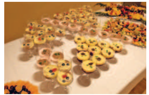
Dank vielen Schülern der Oberschule, engagierten Mitarbeitern und ehemaligen Kollegen der Stadtverwaltung war das Buffet optisch und geschmacklich nicht zu übertreffen