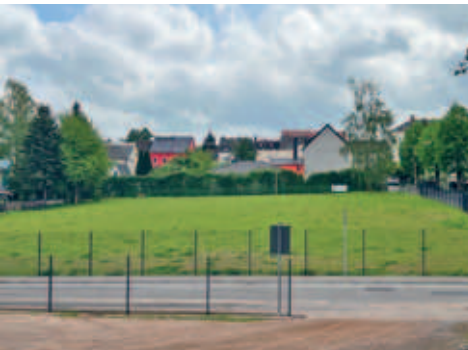
Verlegung der Hundefreilaufwiese auf die Freifläche an der Ecke Feldstraße/Wiesenstraße