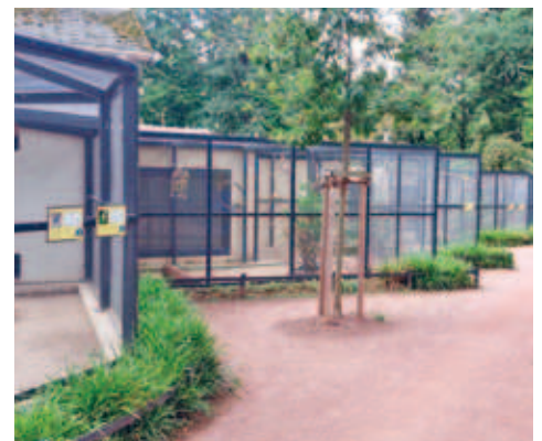
Hinweistafeln an den Vogelvolieren befestigt