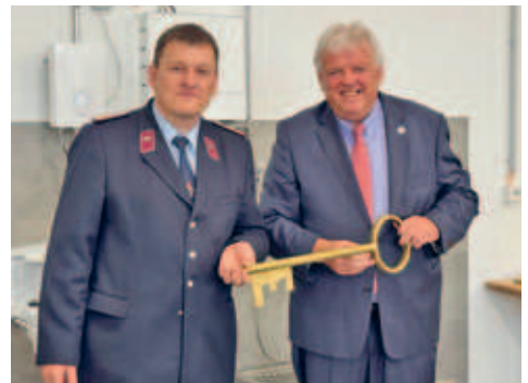
feierliche Einweihung des neuen Feuerwehrgeräte- und Dorfgemeinschaftshaus in Cunnersdorf im Mai