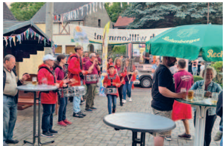
stimmungsvolles Dorffest in Riechberg