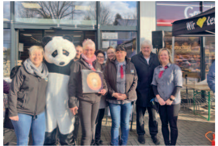
EDEKA-Markt feierte 10jähriges Bestehen