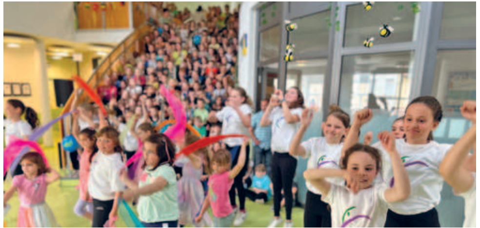
10jähriges Jubiläum der Eduard-Feldner-Grundschule und vom DRK Hort AlberTina