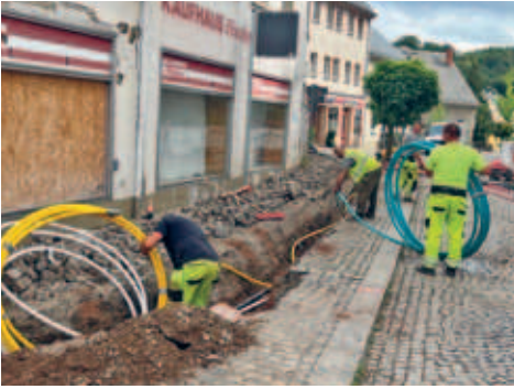
Breitbandausbau in der Stadt und in den Ortsteilen fast abgeschlossen