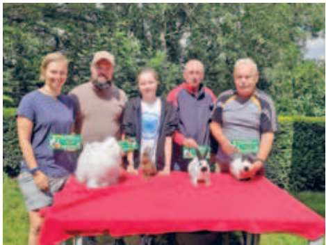
Saisonaufakt bei den Züchterinnen und Züchtern des Kaninchenzüchtervereins S 205 Hainichen