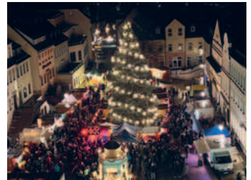
Der Hainichener Weihnachtsmarkt 2023 war ein voller Erfolg.