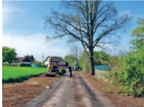
Radwegverbindung Lerchenweg - Am Bad vorzeitig fertiggestellt