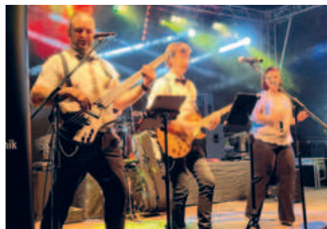
Parkfest fand bei traumhaften Wetter im Stadtpark statt