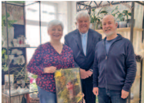
30 Jahre Blumeneck Kreinacker