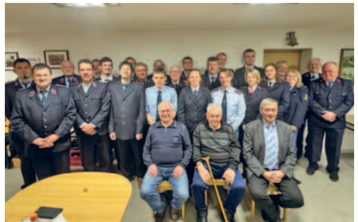
Jahreshauptversammlung der FFW Cunnersdorf am 01.03.2024