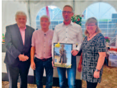
25 Jahre Möbelmontage Gudde