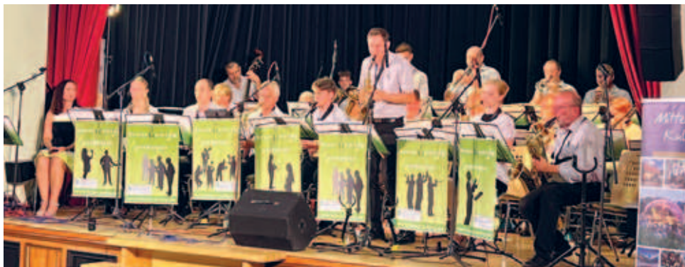
Brass- und Swingorchester spielte am 18.08. bekannte Melodien von Fips Fleischer