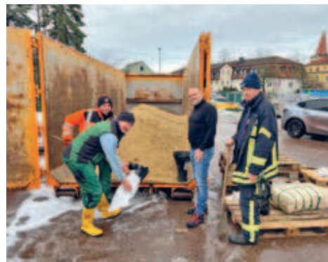
Frühjahrsputz in den Ortsteilen Gersdorf und Falkenau