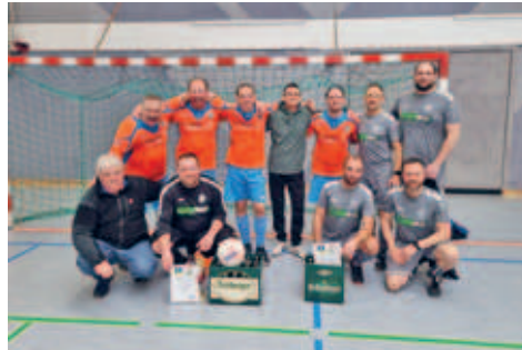
FSV Sachsen Hainichen verteidigte den Stadtmeistertitel im Hallenfußball