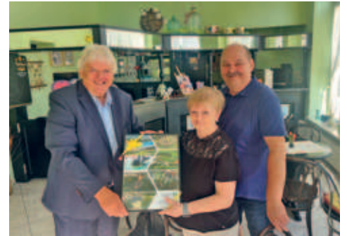
40 Jahre Naschkatze