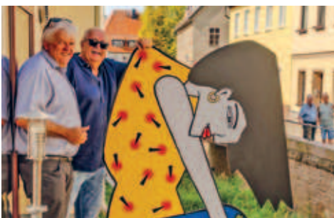
Einweihung der „Wäscherin“ zum 1. Spülfest