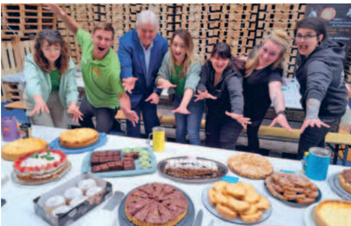
Angrillen bei der Firma Naturbrennstoffe entwickelt sich zu einem der größten Feste in Hainichen mit mehr als 700 Besuchern