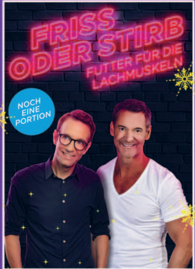
Peter Imhof & Christian Henze - Friss oder stirb am 02.03. 2025