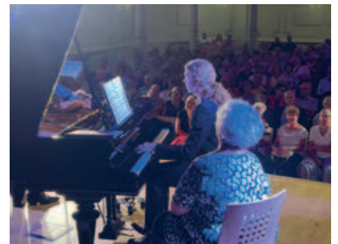
MDR Musiksommer gastierte am 25.8. im Goldenen Löwen