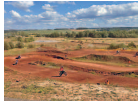
ADAC Motocrossrennen in der Lehmgrube - spektakuläre Rennszenen