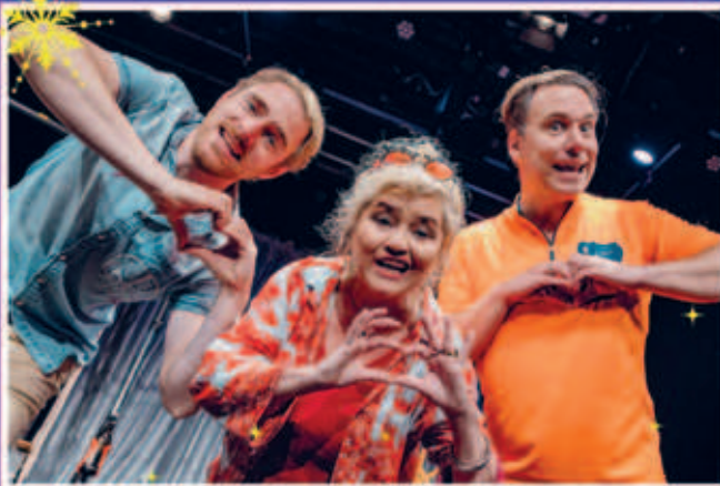
Die Herkuleskeule Dresden am 23.05.2025