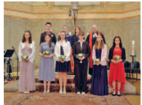
Konfirmation in der Trinitatiskirche am 19.05.2024