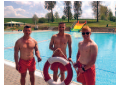
Freibad schließt nach 109 Badetagen am 10.09.2024