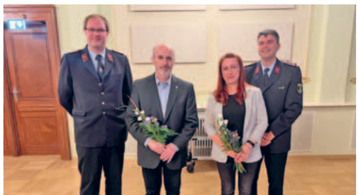
alle 5 Jahre treffen sich die Mitglieder unserer 6 Ortsfeuerwehren, so auch 2024