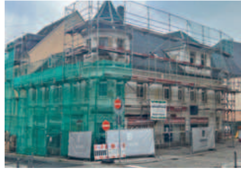
Umbauarbeiten im ehemaligen Fischer-Kaufhaus, Neueröffnung von Ernsting's family geplant