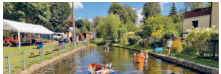
tolle Stimmung beim 12. Cunnersdorfer Badewannenrennen im August