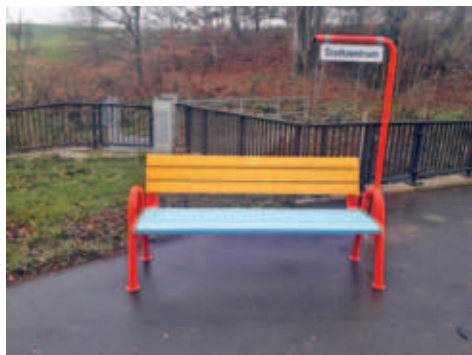
Mitfahrerbank in Crumbach von Unbekannten gestohlen