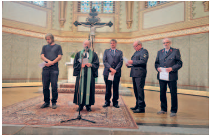
1. Blaulichtgottesdienst in der Trinitatiskirche