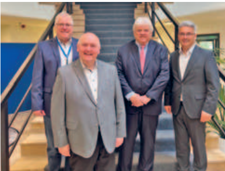
Steuerbüro Woltsche, Brieskorn & Partner bezog neue Räumlichkeiten auf der Äußeren Gerichtsstraße 4