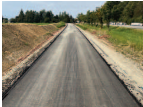
Radweg an der B169 zwischen Gersdorf und Falkenau, Baubeginn am 03.06.2024