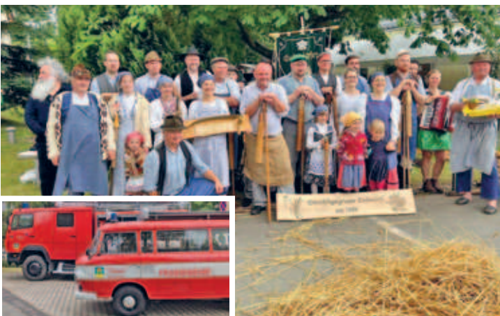
Eulendorf feierte 740 Jahre mit Stadtwettkampf der Hainichener Ortswehren und Präsentation der Dreschflegelgruppe