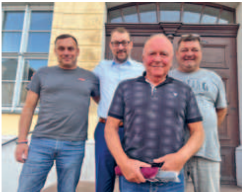
neue Ortschaftsräte haben sich in Bockendorf, Cunnnersdorf, Eulendorf, Riechberg und Schlegel konstituiert