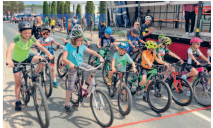
12. Wolfram-Lindner-Gedächtnisrennen am 12.05.2024