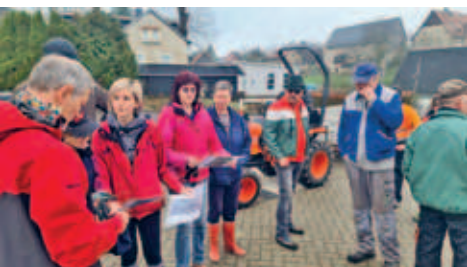
Schlegeler Subbotnik im März