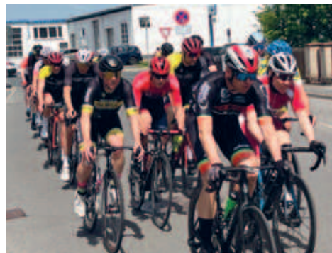
Hainichener Radsportverein wurde aufgrund seiner jahrelangen Verdienste geehrt