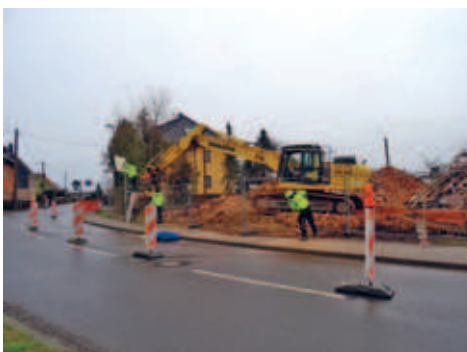
Abbrucharbeiten an der Nossener Straße 14 beendet