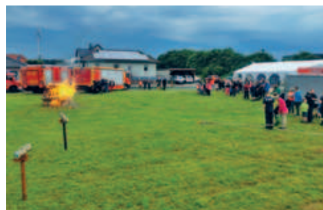
30. Feuerwehr- und Kinderfest in Gersdorf/Falkenau