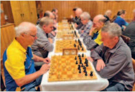
traditionelles Blitzschachturnier des SV Motor Hainichen