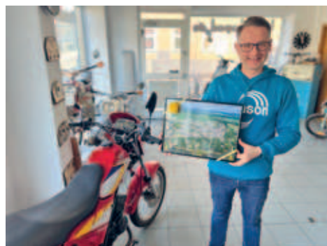
20 Jahre Oldsmoped