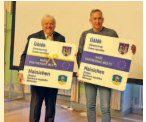
5 Jahre Städtepartnerschaft Hainichen - Ústěk