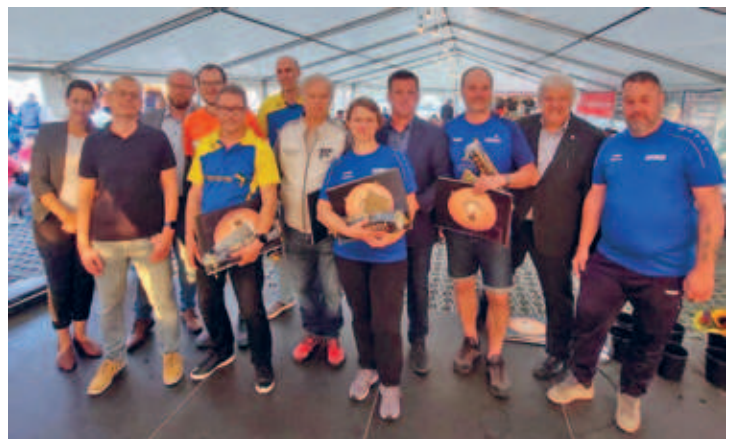
75 Jahre SV Motor Hainichen 1949 e. V.