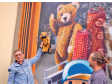
offizielle Einweihung des Graffiti an der Carwash Hainichen