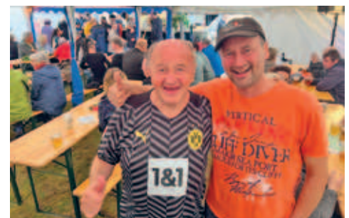
tolle Stimmung beim 6. Georgenstraßenfest