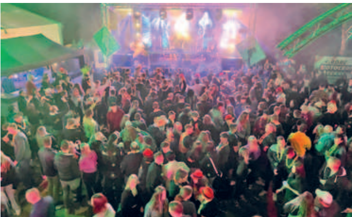
Krach am Bach – mehr als 3000 junge Leute bei der größten Jugendfete Mittelsachsens im JCB