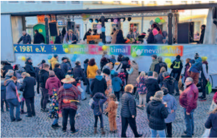
Faschingsumzug, Kinderfasching und die große Faschingsparty im HKK