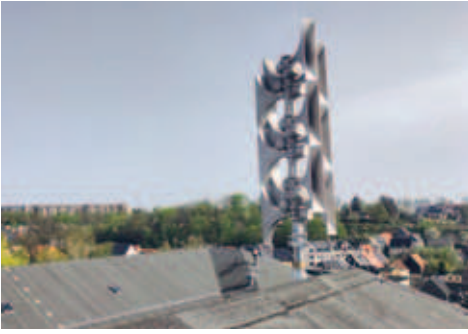
Dach der Oberschule hat seit April eine Sirene, die bei Katastrophen warnen und informieren soll