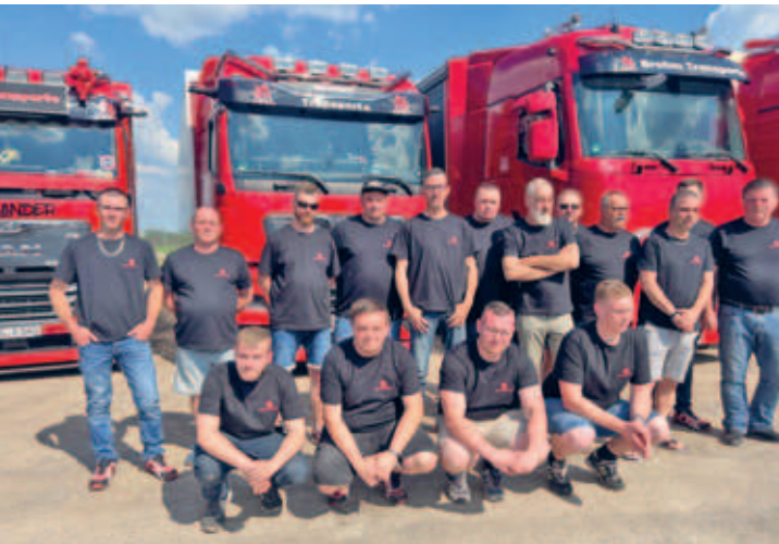
30 Jahre Brehm Transporte