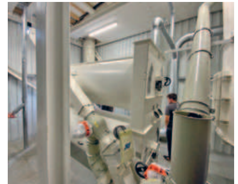
BayWa investierte rund 4 Mio € in den Standort Hainichen