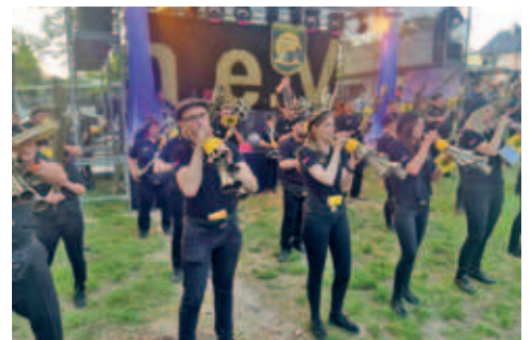
Camera Obscura Fest mit Besucherrekord am 04.05.2024