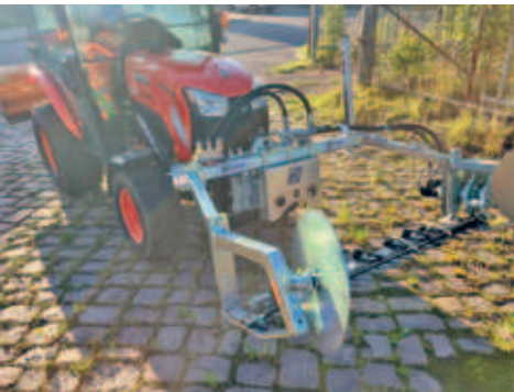
Messermähwerk für den Stadtpark durch den Förderverein Altstadt Hainichen e. V. angeschafft