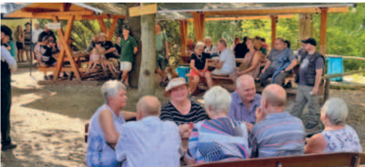
30. Jäger- und Anglerfest - viele Gäste finden sich rund um das Schweizerhaus ein