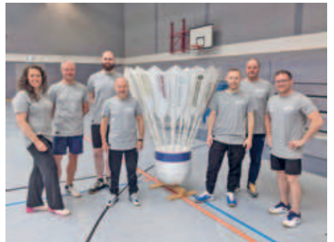
Badmintonabteilung des SV Motor Hainichen als hervorragender Gastgeber der Badmintonspiele bei den Nichtaktiven