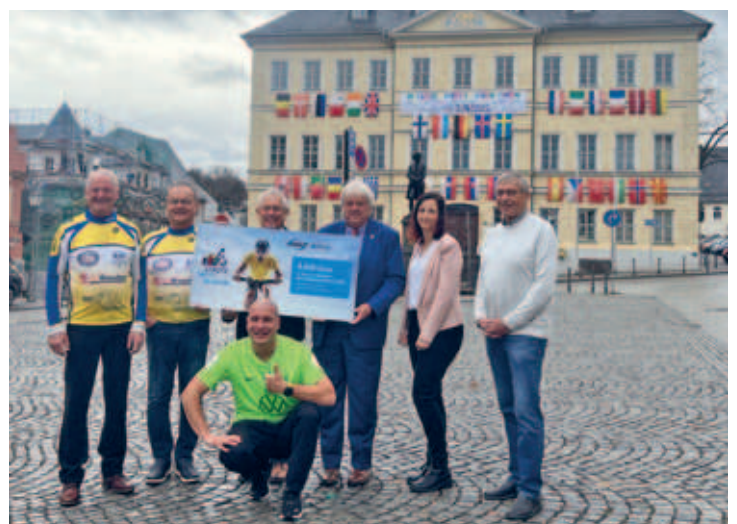
Hainichen gewann beim Enviam Städtewettbewerb 4.400 €