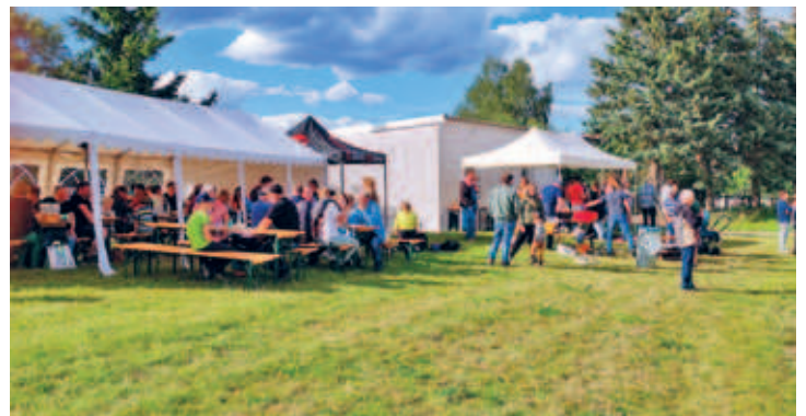
Sommerfest des ATV im Juni 2024