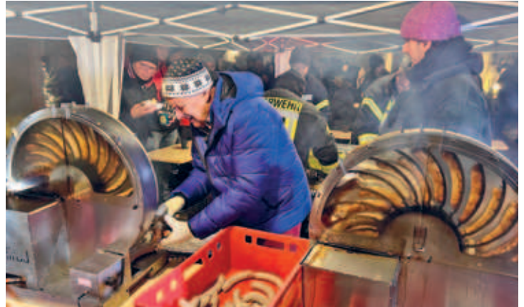
Erfindung aus der Schweiz - Grillrad kam zum Pyramidenanschub zum Einsatz