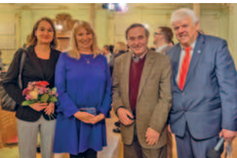
Sachsens Staatsministerin für Soziales und Gesellschaftlichen Zusammenhalt, Frau Petra Köpping, zu Besuch auf dem diesjährigen Neujahrsempfang