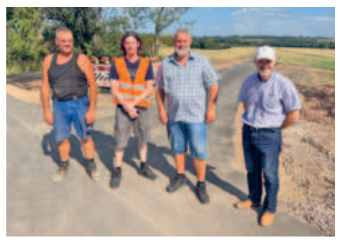
Radweg zwischen B169 und Gartenstadt freigegeben