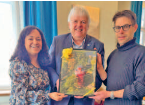
30 Jahre JMEM (Jugend mit einer Mission)