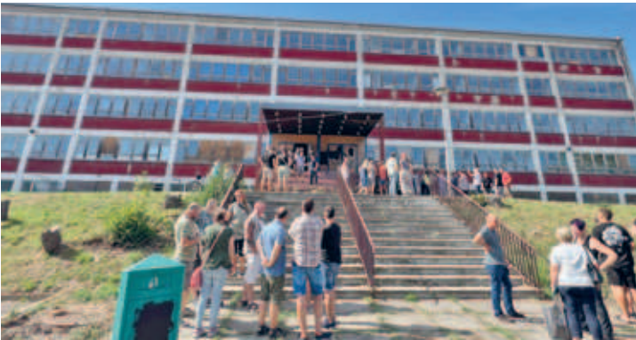
gut besuchte Veranstaltungen zum Tag des offenen Denkmals - über 1.000 Interessierte besuchten die ehemalige Maxim-Gorki-Mittelschule