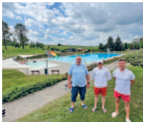
Beginn der Badesaison am 25.05.2024