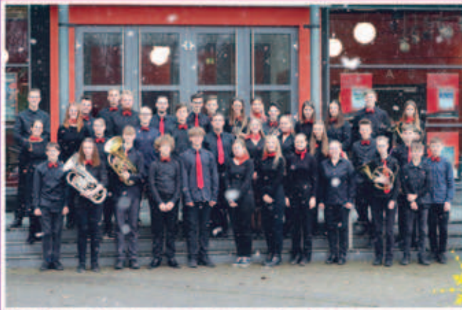
Sinfonisches Blasorchester Frankenberg - Winterkonzert am 09.02.2025

Ausblick auf einige unserer Veranstaltungen im „Goldenen Löwen“ für nächstes Jahr