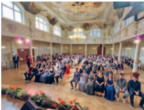
Jugendweihe im Goldenen Löwen am 11.05.2024