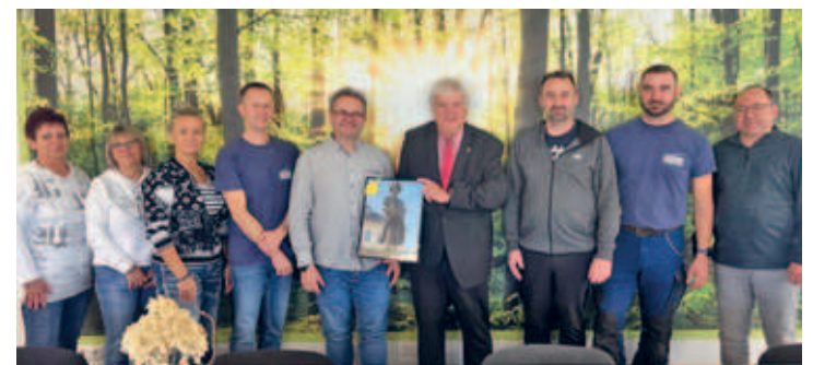
25 Jahre Firma Sonnenberg