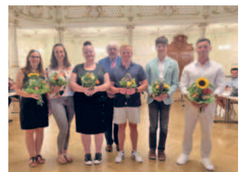
Stadtverwaltung beliebter Ausbildungsbetrieb