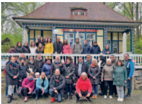
Betriebsausflug der Stadtverwaltung nach Thüringen - Saalfelder Feengrotten und Jena