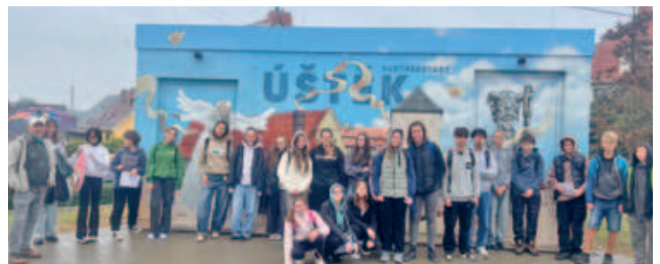
Schüler aus Ústěk besuchten die Friedrich-Gottlob-Keller-Oberschule - ein erlebnisreicher Tag für die Jugendlichen