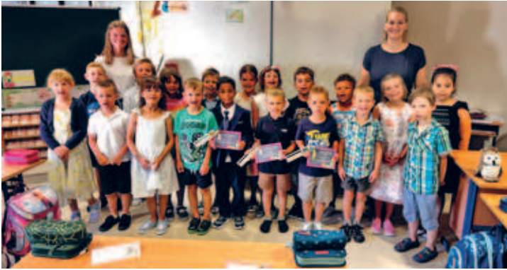
Schulanfang in Eduard-Feldner-Grundschule - 67 Kinder wurden in 3 ersten Klassen aufgenommen