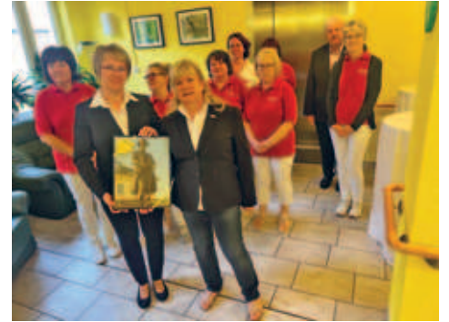
25 Jahre DRK Tagespflege Hainichen