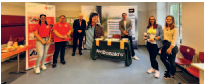
Friedrich-Gottlob-Keller-Oberschule veranstaltete Tag der offenen Tür am 11.09.