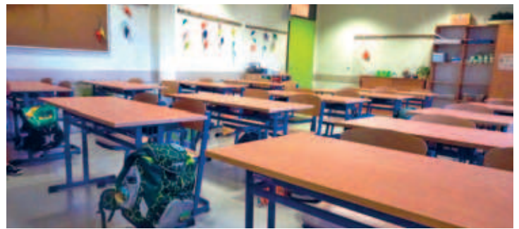
Eduard-Feldner-Grundschule erhielt in den Sommerferien neue Klassenzimmermöbel