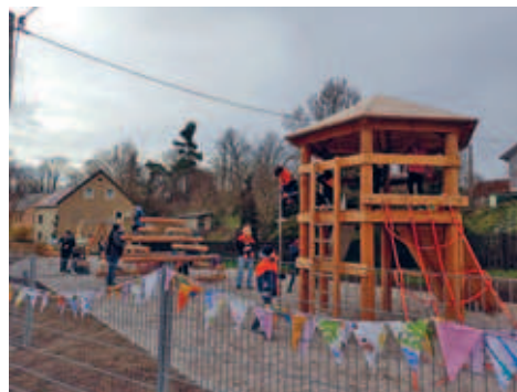
Spielplatzöffnung in Cunnersdorf am 28.03.2024