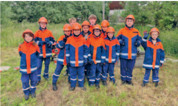
FFW Eulendorf siegte als Gastgeber beim Stadtwettkampf der Hainichener Ortswehren