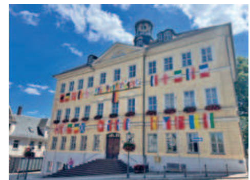
Fahnen der Teilnehmerländer der Fußball-Europameisterschaft zierten die Rathausfassade

Impressum: Herausgeber: Oberbürgermeister Dieter Greysinger, ViSdP: für den amtlichen Inhalt: Oberbürgermeister Dieter Greysinger, Gesamtherstellung: Verlag: Redaktion, Herstellung RIEDEL GmbH & Co. KG – Verlag für Kommunal- und Bürgerzeitungen Mitteldeutschland, Gottfried-Schenker-Str. 1, 09244 Lichtenau OT Ottendorf, Tel. 037208 876-100, info@riedel-verlag.de, verantwortlich: Hannes Riedel.