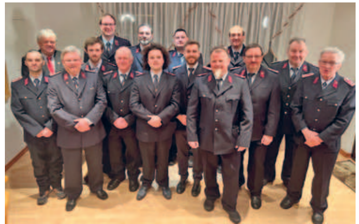
Jahreshauptversammlung der FFW Schlegel am 26.01.2024