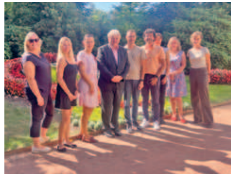
Vertreter der Städte Frankenberg und Hainichen sowie der Gemeinde Niederwiesa trafen sich zur Zusammenarbeit von texTour