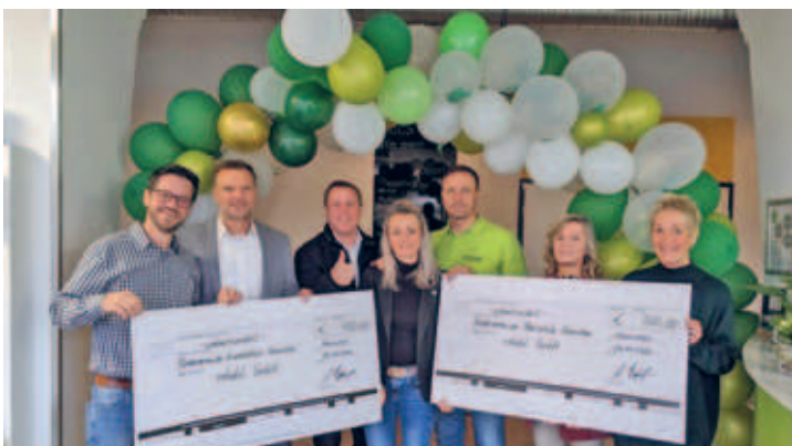
10 Jahre rehab in Hainichen