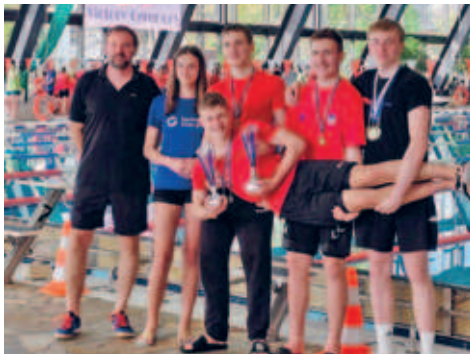
DLRG erkämpfte sich gute Platzierungen bei den Mitteldeutschen Regionalmeisterschaften im Rettungsschwimmen in Gera