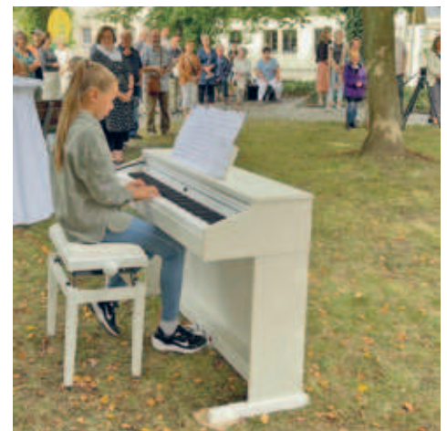
Einweihung der Skulptur am Purple Path - „Endless Column“