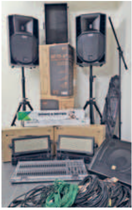
neue Technik für die Freilichtbühne dank "Altzella rockt" angeschafft