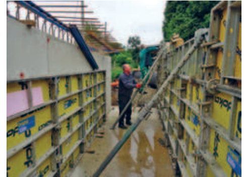
Erneuerung der maroden Brücke in Riechberg liegt gut in der Zeit