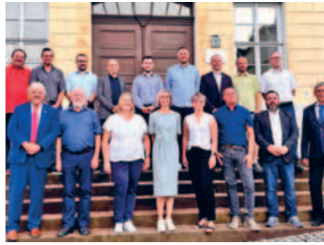
neuer Hainichener Stadtrat konstituierte sich am 14.08.