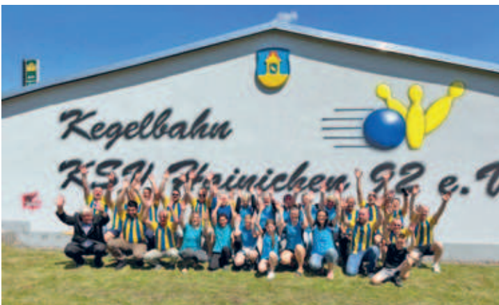
Vereinsmeisterschaft der Hainichener Kegler