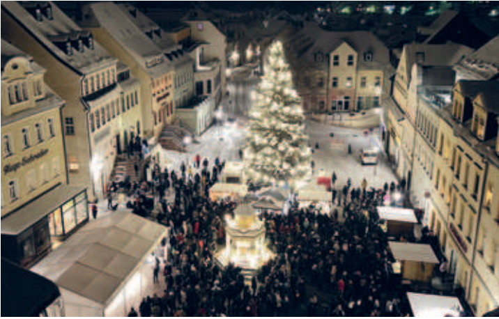
Pyramidenanschub am 1. Advent