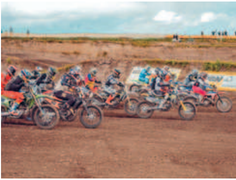
MSV Hainichen war ein hervorragender Gastgeber für zwei Renntage in der Lehmgrube