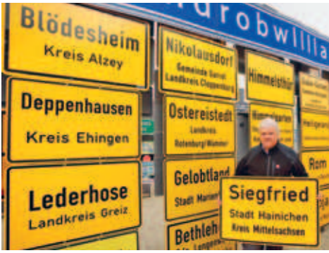
Ortseingangsschild von Siegfried wurde an den Fernweh-Park Oberkotzau überreicht