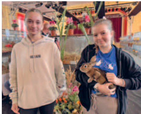
Kreisjungtierschau des Kreisverbandes Mittweida - erfolgreiche Züchter in Hainichen ausgezeichnet