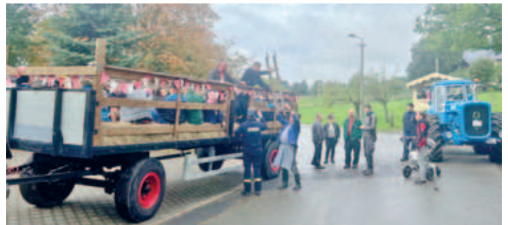
5. Eulendorfer Kartoffelfest lockte zahlreiche Besucher in den kleinen Ortsteil