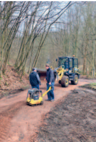
Schlegeler Subbotnik im März