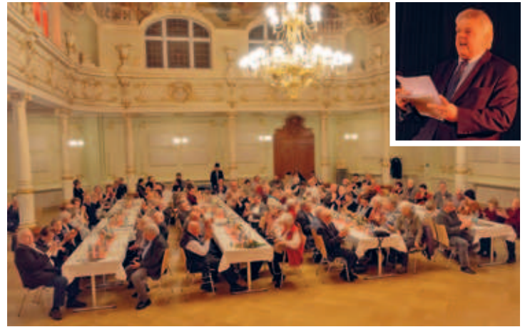
Am 13.02.2024 fand die alljährliche Feier der Liebe "Marriage Week" im Goldenen Löwen statt.