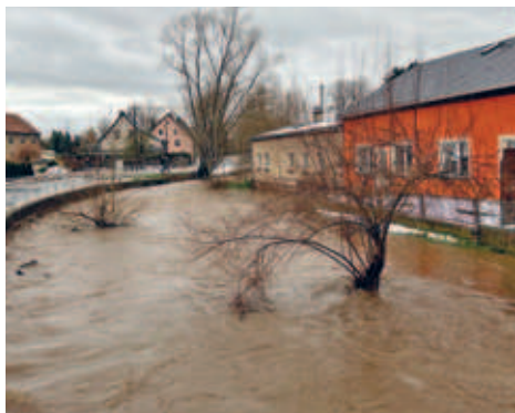
Hochwasser am 24.12.2023