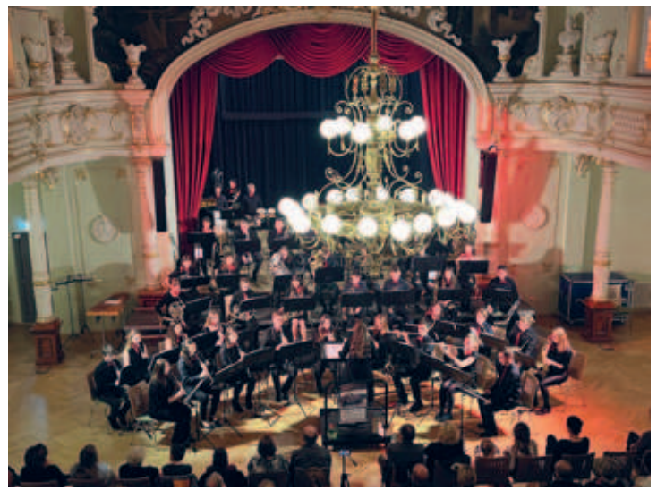
Sinfonisches Blasorchester Frankenberg begeisterte Besucher am 4.2.