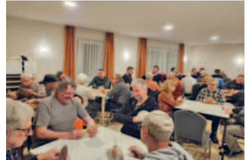
Teilnehmerrekord beim 22. Bockendorfer Skatturnier