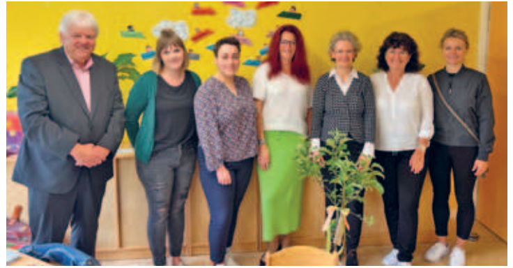
30jähriges Jubiläum der DRK Kindertagesstätte Storchennest am Ottendorfer Hang