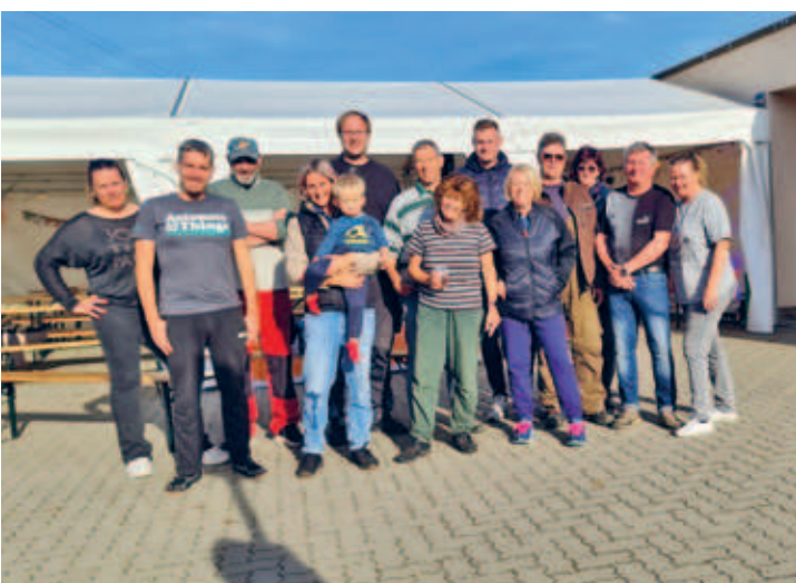
Schlegel feierte wieder ein tolles Herbstfest