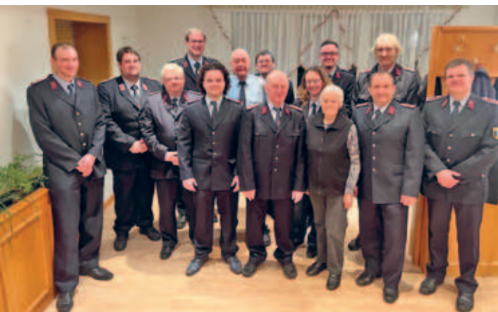
Ehrung langjähriger Feuerwehrmitglieder erfolgte durch die Stadt Hainichen am 22.11.