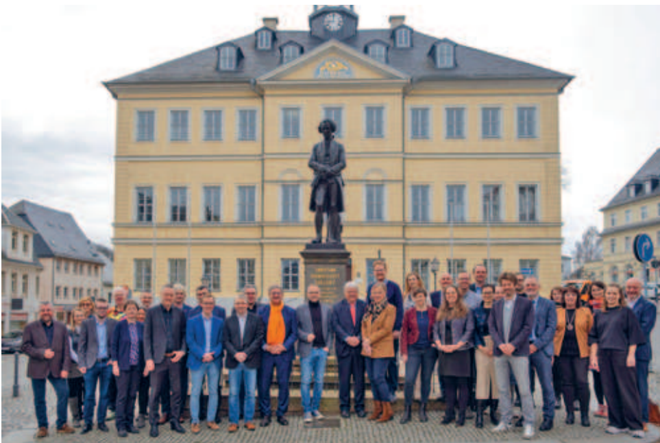
Tagung der Bürgermeister der Kulturhauptstadtregion am 22.03.2024 im Goldenen Löwen