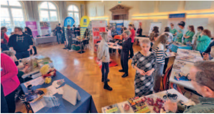
gute Resonanz bei der Ausbildungsmesse der Friedrich-Gottlob-Keller-Oberschule am 18.03.2024