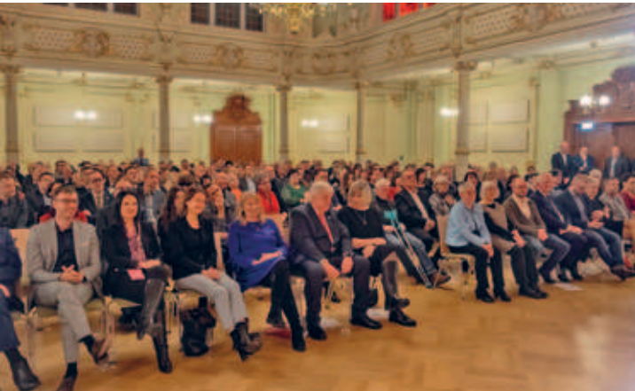
Der Neujahrsempfang am 12.01.2024 fand erneut im Neorokosaal des Goldenen Löwen statt.