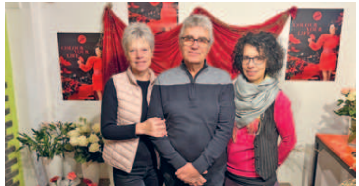
„Blumen am Markt“ beendete Geschäftstätigkeit zum 23.12.2023