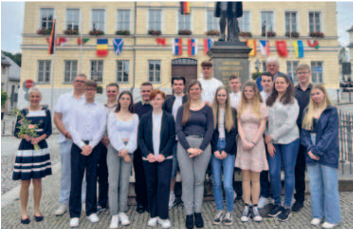
Würdigung der besten Schulabgänger der Friedrich-Gottlob-Keller-Oberschule und des Martin-Luther-Gymnasiums Frankenberg