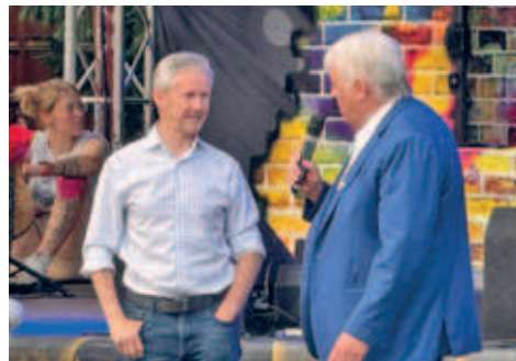
prominenter Gast beim Hainichener Parkfest- Jens Weißflog