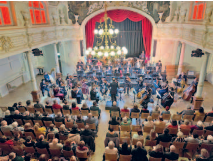
fulminantes Neujahrskonzert der Mittelsächsischen Philharmonie am 7.1.