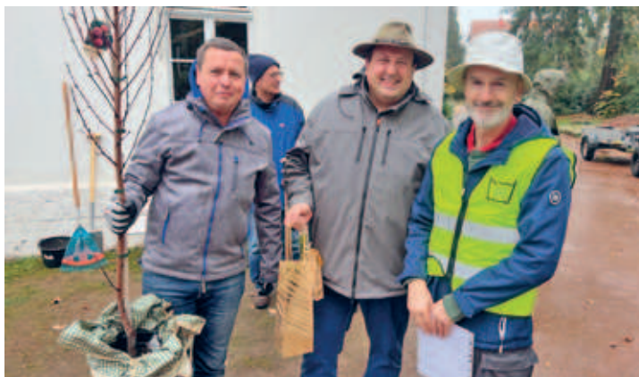
Parkpflegetag im Stadtpark mit vielen fleißigen Helfern und Helferinnen