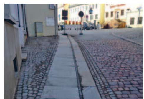
Verlegung von Granitplatten in den Gehwegen (Bequemlichkeitsstreifen)