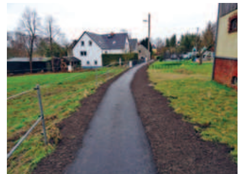
Ausbau des "Kleinen Weges" im Ortsteil Falkenau abgeschlossen