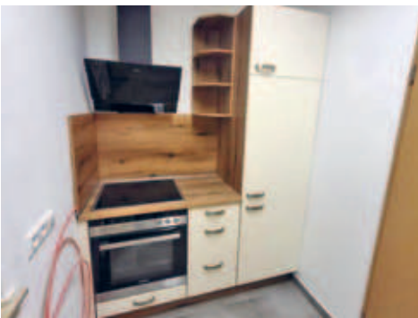
Bauarbeiten im Dorfgemeinschaftshaus Gersdorf abgeschlossen