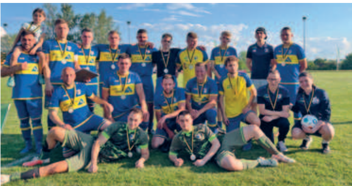
1. Männermannschaft des HFV erreichte erstmals Kreispokalfinale und unterlag dort nur knapp und unglücklich BARKAS Frankenberg