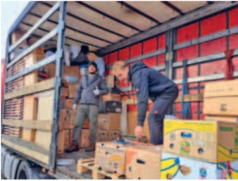
Hilfstransporte von Hainichen in die Ukraine werden aktiv unterstützt