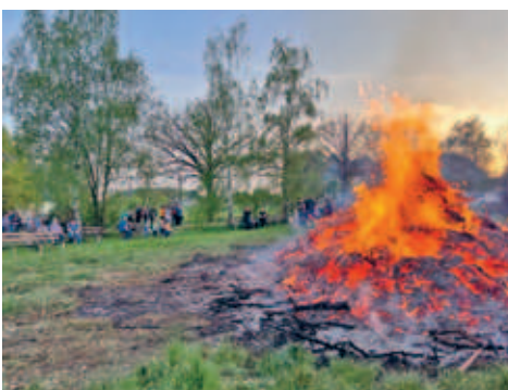
rundum gelungenes Brauchtumsfeuer in Eulendorf am 30.04.2024