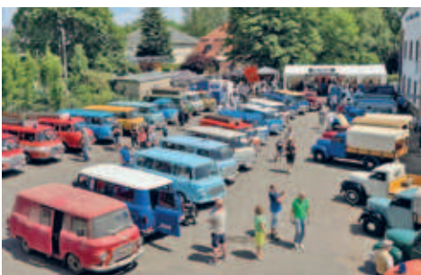
sehr gut besuchtes BARKAS/FRAMO-Treffen am 08.06.2024